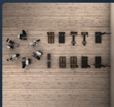
Módulo 2: Circuitos