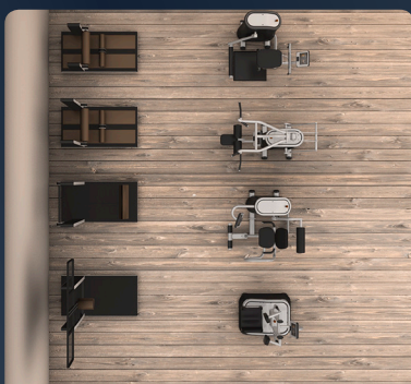
Módulo 1: HIBB