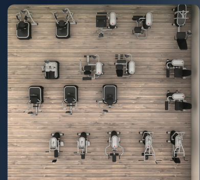
Módulo 3: Stand Alone